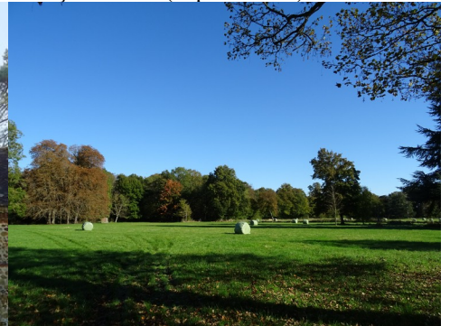
La vue vers les champs et bosquets

Pour la zone en rose foncé dans le périmètre de 500m