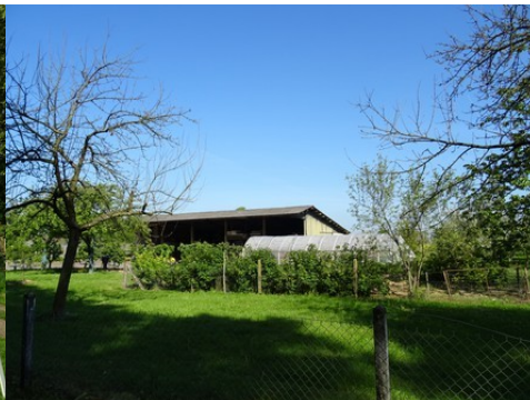
Une exploitation agricole voisine