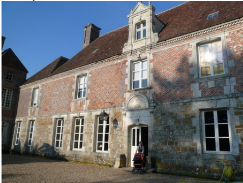
La façade sur cour