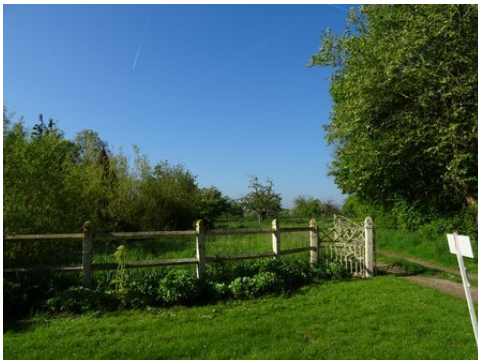
Un verger voisin

Les avis seront cohérents avec ceux émis ces dernières années, à savoir : pas de maisons à volume compliqué (type V, W, Y, ou Z), Rez-de-chaussée + Combles, pentes à 45° pour les volumes principaux, ardoise ou tuile plate de teinte brun vieilli, à 20u/m 2 , avec un débord de toiture de 20cm, enduit de teinte beige clair avec modénatures (au choix : chaînages, encadrement de fenêtres, soubassement, colombage...). *Voir les autres fiches.