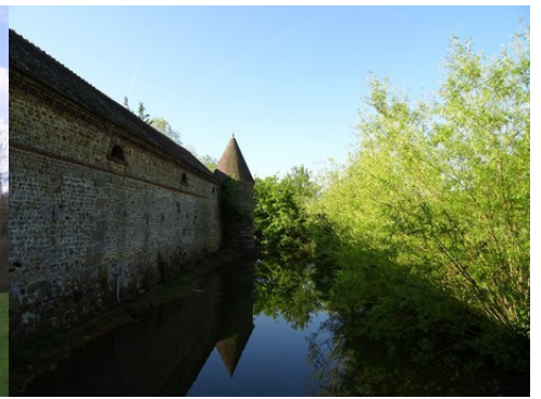
La façade ouest (dépendances)