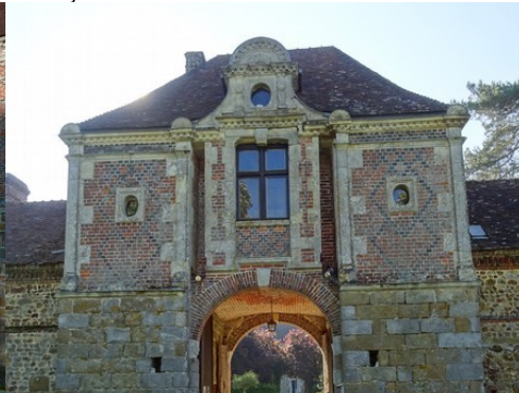
La pavillon d'entrée fortifié