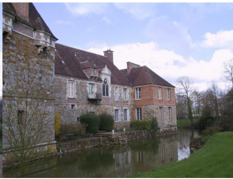
La façade ouest du château