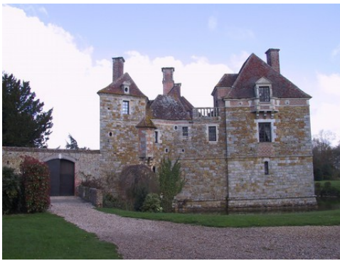
La façade sud du château